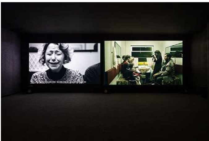
The Iron Road , 2021, 2-Kanal-Videoinstallation, 22 Min., Installationsansicht Tel Aviv Museum of Art, 2023; Courtesy die Künstlerin und Chelouche Gallery Tel Aviv; © Ira Eduardovna © Foto: Elad Sarig