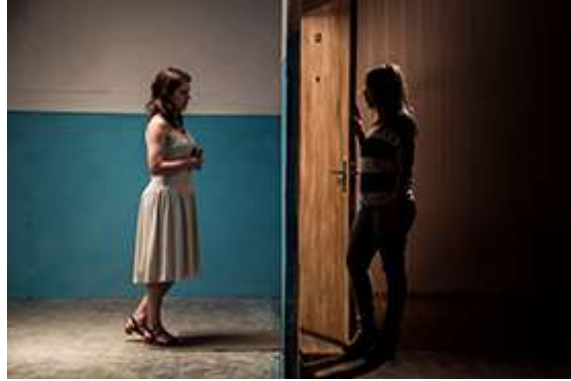
On foreign made soles , 2018, 7-Kanal-Videoinstallation, 19 Min., Still