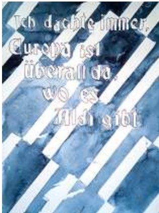
Jody Korbach, Ich dachte immer Europa ist überall da, wo es Aldi gibt , 2018, Aquarell, 21 x 30 cm, Sammlung Philara, Düsseldorf; © Jody Korbach

(*1991 in Bielefeld, lebt und arbeitet in Düsseldorf)