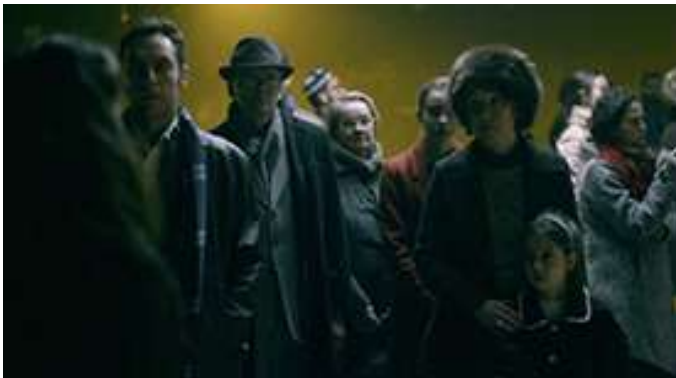
The Iron Road , 2021, 2-Kanal-Videoinstallation, 22 Min., Still Courtesy die Künstlerin und Chelouche Gallery Tel Aviv; © Ira Eduardovna © Foto: Avner Shahaf

(*1980 in Usbekistan; lebt und arbeitet in New York und Tel Aviv)