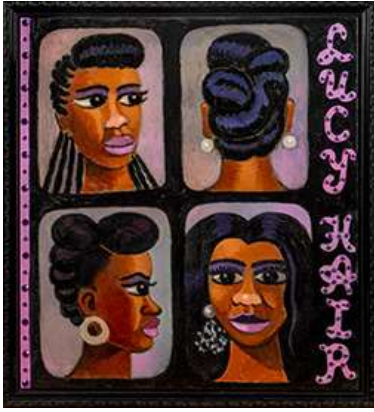
Zoya Cherkassky-Nnadi, Lucy Hair , 2022, Mixed media auf Leinen, 75 x 70 cm Courtesy die Künstlerin und Rosenfeld Gallery, Tel Aviv; © Zoya Cherkassky-Nnadi