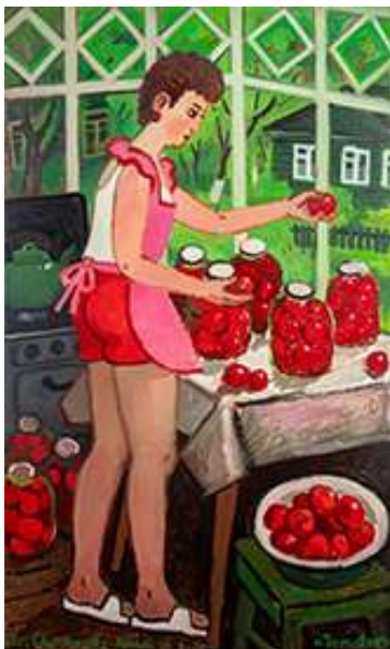
Zoya Cherkassky-Nnadi, Tomatoes , 2023, Öl auf Leinen, 150 x 90 cm