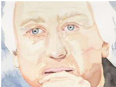
Jody Korbach, Cry me a River , 2023, 34 x 44 cm, Aquarell, Courtesy Galerie Martinetz; © Jody Korbach; © Foto: Johannes Bendzulla