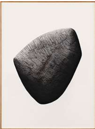
Ahmet Dođu İpek, Repair (Y) , 2022, Aquarell und Goldstaub auf Papier, auf Leinwand montiert canvas, 185 x 135 cm, Mehmet San Collection; © Ahmet Dođu İpek