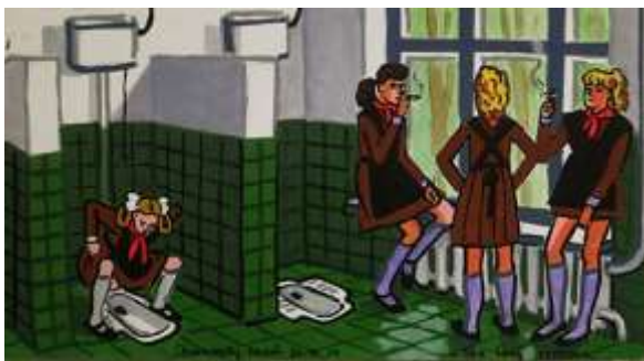
Zoya Cherkassky-Nnadi, The Long Recess , 2016 (aus der Serie My Soviet Childhood ), Filzstifte und Aquarell auf Papier, 21 x 30 cm, Courtesy die Künstlerin und Rosenfeld Gallery, Tel Aviv; © Zoya Cherkassky-Nnadi

(*1976 in Kiew, lebt und arbeitet in Tel Aviv-Yafo)