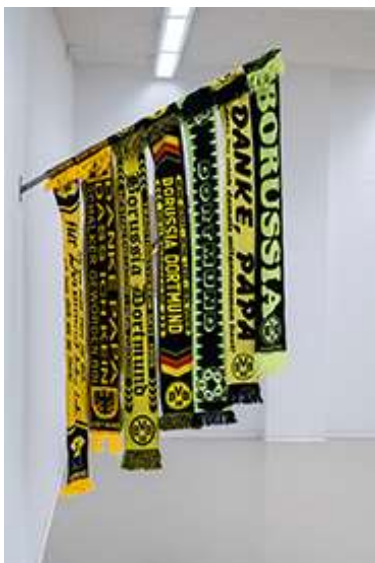
Jody Korbach, Identitätspolitik, Strukturwandel und Danke für gar Nichts (Papa) , 2021, Fanschals, Installation, ca. 170 x 140 cm, Courtesy Galerie Martinezz; © Jody Korbach