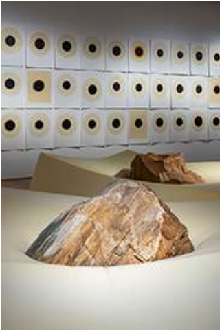
Ahmet Dođu İpek, Subjected , 2022, Installation (Schaumstoff, Naturstein, 70 x 375 x 225 cm) Ausstellungsansicht Arter, 2022; © Ahmet Dođu İpek