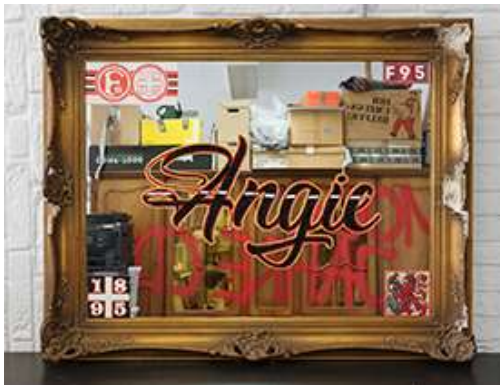
Jody Korbach, Angie (Ein Leben lang) , 2021; Spiegel, Window Color auf Sperrmüll, 78 x 98 cm; Sammlung Unterreitmeier-Lessig; © Jody Korbach