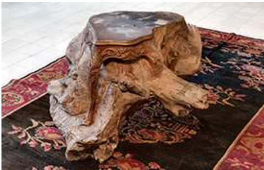
Ahmet Doğu İpek, Table II , 2017, handgeschnittzte Walnuss-Wurzel, 94 x 126 x 52 cm Istanbul Museum of Modern Art Collection; © Ahmet Doğu İpek

(*1983 in Adıyaman, Türkei, lebt und arbeitet in Istanbul)